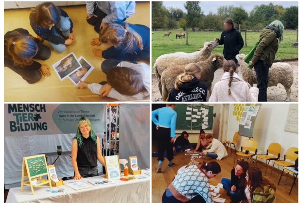
Eindrücke von unserer Arbeit: Workshops in Berlin und im Land der Tiere, unser Stand beim Veganen Straßenfest Hamburg und die Moderierenden-Schulung in Berlin